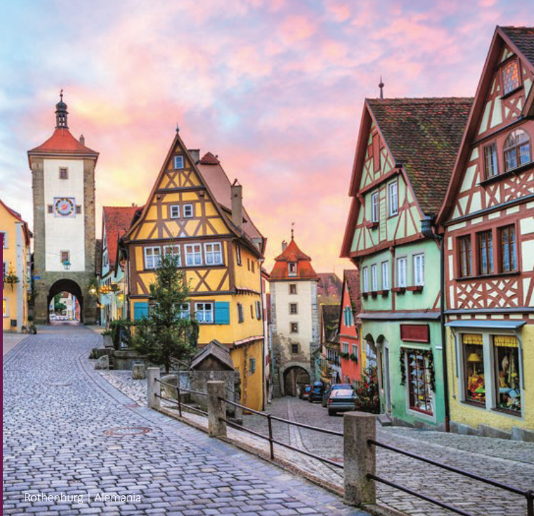
Rothenburg | Alemania